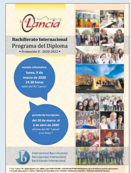
Cartel del Bachillerato Internacional del IES Lancia.

El Instituto Lancia de León celebrará el lunes 9 de marzo una reunión informativa, a las 19.00 horas, dirigida a los alumnos de la provincia interesados en realizar sus estudios en el Programa del Diploma de Bachillerato Internacional. El IES Lancia es el único centro educativo de la provincia donde se puede cursar de forma gratuita. El plazo de preinscripción se abrirá el próximo 20 de marzo y concluirá el 2 de abril.