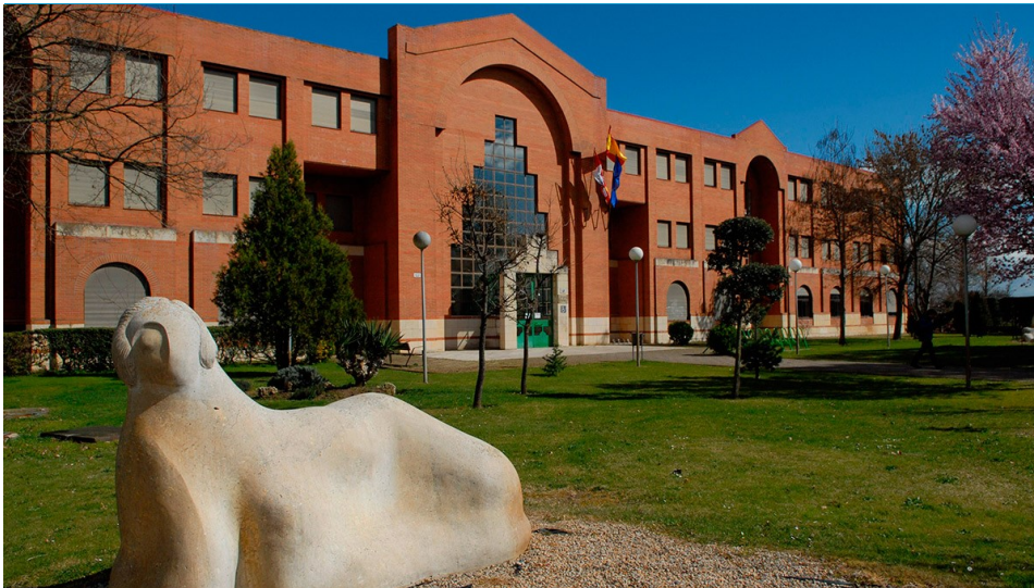
Imagen de archivo del IES Lancia. | L.N.C.