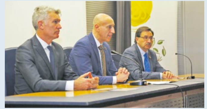
Inauguración de la jornada de evaluación del riesgo del arbolado en las ciudades.